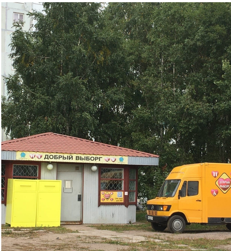
Павильон «Добрый Выборг» Прием и выдача гуманитарной помощи